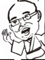
六代目笑福亭 枝鶴襲名